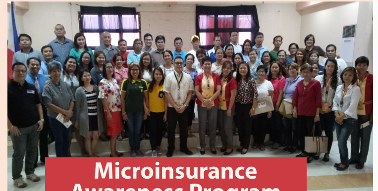
Microinsurance Awareness Program

Ang CARD MBA ay lumahok sa makabuluhang programang Microinsurance Awareness Program sa pangunguna ng Insurance Commission (IC) sa lungsod ng Tanauan sa Batangas noong ika-5 ng Marso, 2018. Kasama rito ang iba't ibang piling panauhin mula sa hanay ng Life, Non-Life insurance at Microinsurance Sectors upang makapagbahagi ng kaalaman sa mga pinuno ng iba't ibang Organized Group at maliliit na kooperatiba.